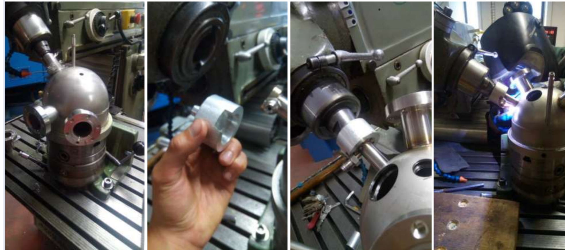
La pièce intermédiaire...

Nécessité grande précision de l'angle d'inclinaison → Pièce spécifique usinée – montée sur le porte outils – permet de maintenir la bride dans la pièce avec un montage sans jeu